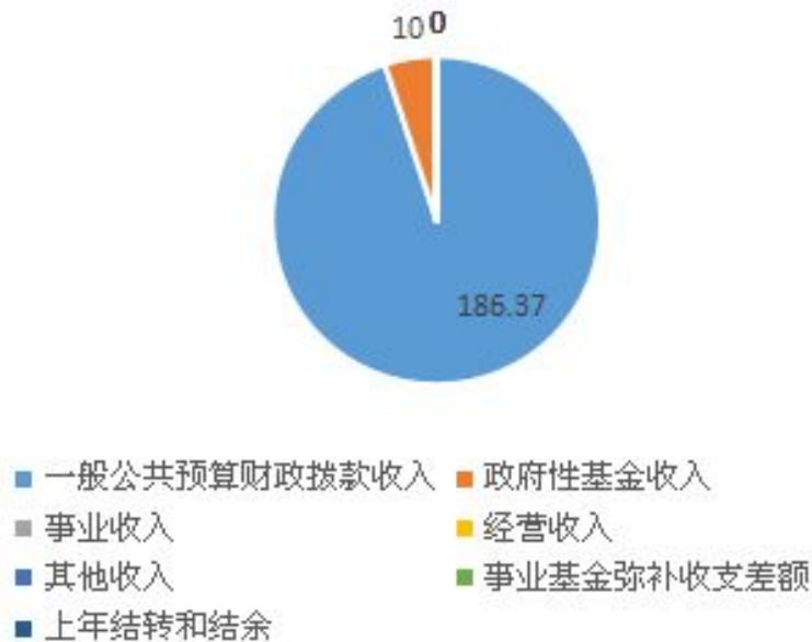
本年度收入构成情况

(7) 上年结转和结余 0 万元，为以前年度尚未列支，结转到本年仍按按规定用途继续使用的资金，本部门无结转结余。