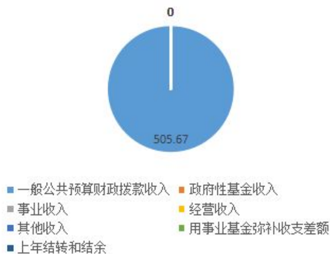
本年度收入构成情况

(7) 上年结转和结余 0 万元，为以前年度尚未列支，结转到本年仍按按规定用途继续使用的资金无。